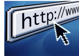
CONEXION INTERNET (OPCIONAL)