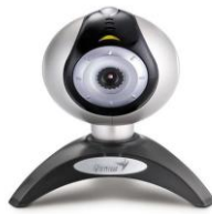
CAMARA WEB (OPCIONAL)