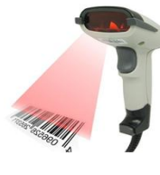
L. CODIGOS (OPCIONAL)