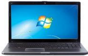
PC / PORTATIL / TABLET (WINDOWS XP / W7 / W8)